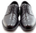
רוםקלאסי כללי בחירה אלגנטית למשקיעים שקולים

המסלול לעמית המאוזן - מסלול בו נצברו קרוב לשלושים שנות ניסיון, מסלול זה משמש "ברירת המחדל" לגבי עמיתים חדשים וותיקים כאחד, וכן כ"שכיל הזהב" לבחירה מרכזית בין שלוש המסלולים. עמיתים קיימים בקרן ממשיכים את חסכונותיהם והפקדותיהם במסלול זה, אלא אם יחליטו אחרת, ויאשרו זאת בחתימתם.